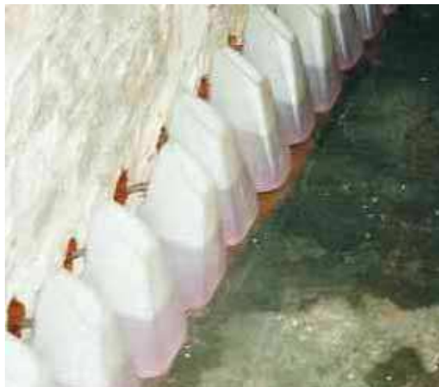
Рисунок 1: Материал PCI Bohrlochsperre в течение не менее 24 часов проникает в кладку из накопительных ёмкостей.